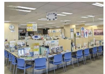
▲阪急グランドビルトラベルセンター

内 容：関連チラシ設置(世界お茶まつり2025、JR静岡駅集合解散 ツアーの案内、関西圏のカフェ巡りスタンプラリーの案内等)、 販促物による情報発信