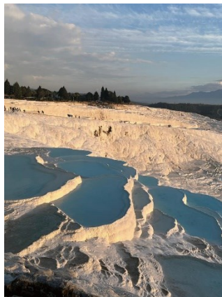
左：トルコ（パムッカレ）