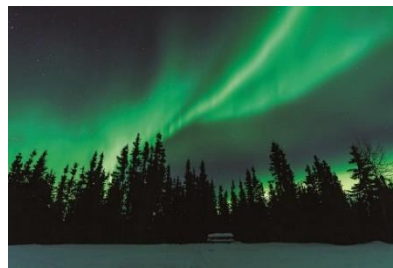
オーロラ (イメージ)