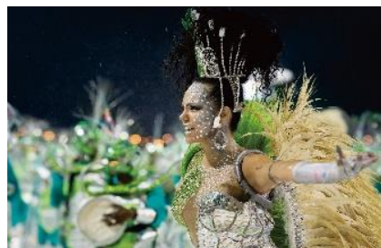
リオデジャネイロ