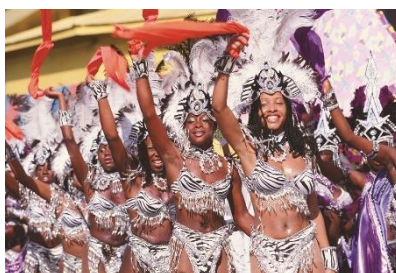
トリニダード・トバゴ