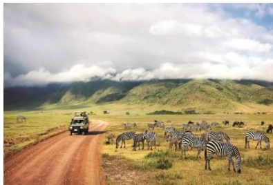
ンゴロンゴロ自然保護区