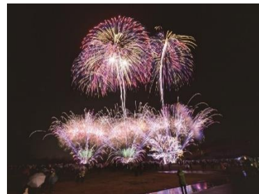
▲新潟県/長岡花火大会