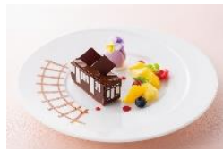
阪急電車型ケーキ