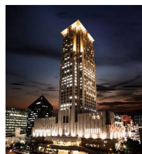
ホテル阪急インターナショナル外観