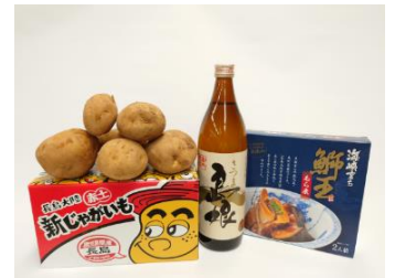
▲参加者へのお土産（イメージ）