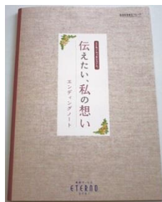
エンディングノートプレゼント