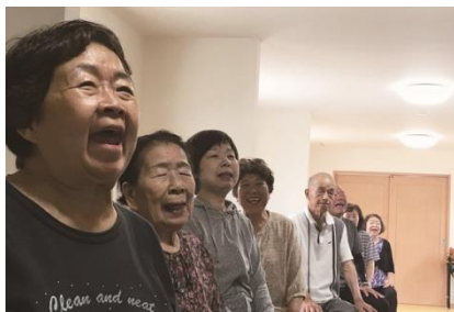
いきいき百歳体操

阪急交通社は、これからも皆さまのニーズにお答えする価値ある旅を提案してまいります。