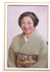
プロカメラマン撮影