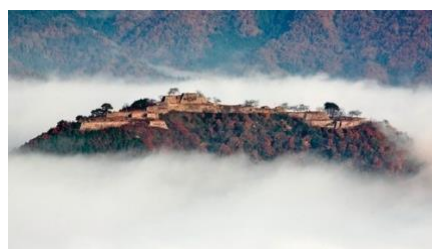
雲海に浮かぶ竹田城跡（立雲峡撮影）

この企画は、一昨年から実施しており好評のため、今年は設定日を増やして 8 出発日を用意しました。