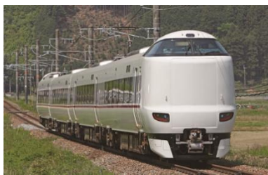
JR 列車 287 系「このとり 27 号」