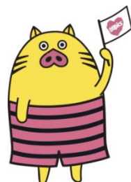
トラピックス マスコット 「トラピッグ」