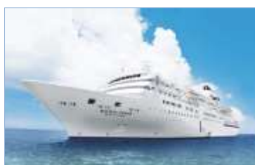
▲ぱしふいっく びいなす

阪急交通社では、これからもお客様のニーズにお応えする魅力あるクルーズ旅を提案してまいります。