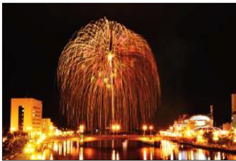
▲釧路大漁どんぱく花火大会

※8月26日出発は、第13回釧路大漁どんぱく花火大会(9月1日、2日、3日開催)をご覧ください