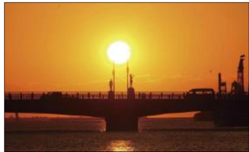
▲釧路の夕日と幣舞橋の絶景