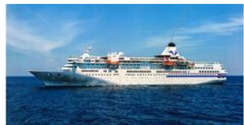
ぱしふいっくびいなす <船舶データ> 乗客定員 620人 / 乗組員数 220人 / 全長 183.4m 全幅 25m / 総トン数 26,594トン / 巡航速度 18ノット

阪急交通社では、2014年から日本船と外国船合わせて15隻の貸切り企画を実施し、日本各地をベストシーズンに寄港する航路で魅力あふれるクルーズを提案しています。昨年夏の外国船“ダイヤモンドプリンセス”チャータークルーズでは、ご家族や三世代での参加者の増加がみられ、船上で実施したアンケートによると、クルーズに対する意識は、豪華な長旅イメージから、“気軽で手軽な快適旅”へと変化しつつあります。アンケート結果を受けて、本クルーズは、ご家族やご友人同士でも参加しやすいように、夏休み期間の週末を利用した設定です。横須賀に寄港した後、熱海沖へ移動し、船上という特等席で海上花火を観賞します。目覚めた翌朝は、南海の楽園八丈島に上陸し、離島固有の自然と文化に触れることができます。船上ではお祭りや踊りなどの当社オリジナルイベントをお楽しみいただくなど、クルーズライフの醍醐味を味わっていただきます。