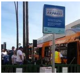
ユニオン駅ではこの看板が目印