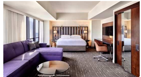
※客室一例(イメージ) ※お選びいただけません