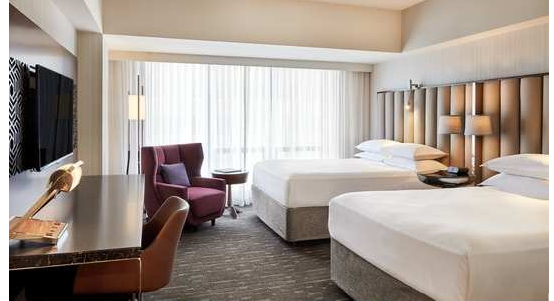
※客室一例(イメージ) ※お選びいただけません