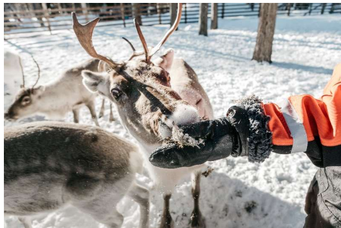
※積雪時の様子です。

サーリセルカ郊外にあるトナカイ牧場を訪ねます。トナカイたちが暮らす牧場で、トナカイたちの生活やラップランド地方でのトナカイと人々のかかわりなどについてご説明いたします。また、トナカイたちへのエサやりも体験いただきトナカイたちとのふれあいをお楽しみください。ツアー終盤には温かいコーヒーとお菓子をお召し上がりください。