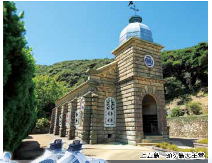
上五島 頭ヶ島天主堂