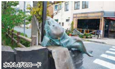
水木しげるロード