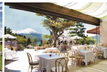
八ヶ岳高原ロッジ 昼食