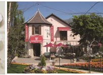
鳥羽でのフレンチランチ