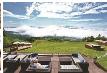
八ヶ岳 清里テラス