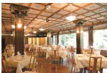
日光金谷ホテル ダイニング

U R L : https://www.hankyu-travel.com/tour/detail_d.php?p_course_id=0D001A&p_hei=30&p_baitai=9582