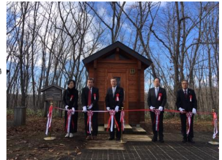
寄贈式テープカット（於：サテライト展望台）