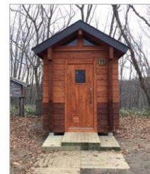
環境保全型トイレ（正面）