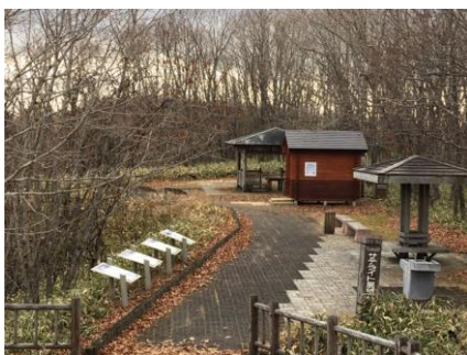
釧路湿原遊歩道 設置場所