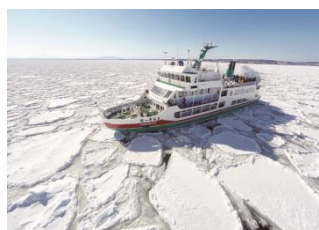
流氷観光砕氷船「おーら」