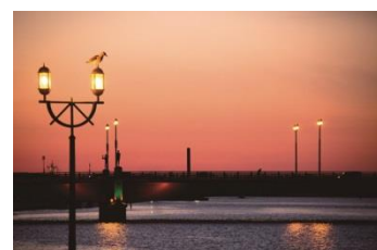
幣舞橋（釧路市）夕景