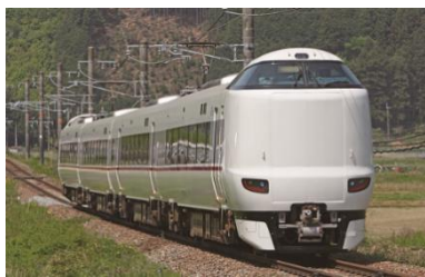
JR 列車 287 系「こうのとりの27号」