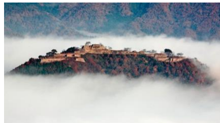
雲海に浮かぶ竹田城跡（立雲峡撮影）

この企画は、一昨年から実施しており好評のため、今年は設定日を増やして8 出発日を用意しました。