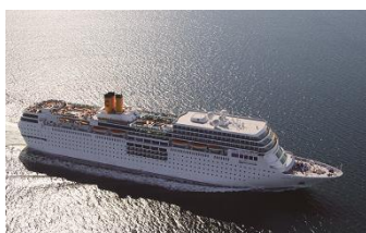
コスタ・ネオロマンチカ