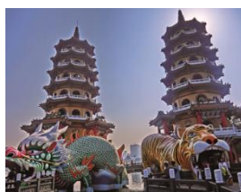
蓮池潭・龍虎塔(高雄)