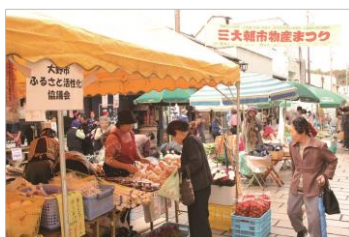
三大朝市物産まつり会場

※400年の歴史を誇る七間(しちけん)朝市が総出店する1年に1回開催の物産まつりで、交流のある飛騨高山や北海道の物産も並ぶ。