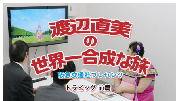
スピノフ・ムービー カット