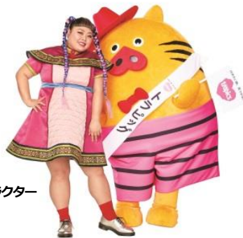
渡辺直美さんと トラピックスのイメージキャラクター 「トラピッグ」

渡辺直美さんは、多才で明るく親しみやすいタレントとして老若男女を問わず人気があり、日々の活躍ぶりから「旅」との親和性も高く、今後いっそうの活躍が期待されることから今回の起用が決定しました。