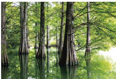
篠栗九大の森（福岡県）

出発日：2018年1月26日（金）、28日（日）、2月4日（日）、10日（土）、3月8日（木）、 3月9日（金）、10日（土）、11日（日）、15日（木）、17日（土）、18日（日）、 3月22日（木）、24日（土）、3月26日（月）、29（木）、30日（金）、31日（土）