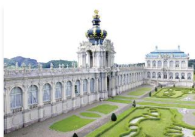
有田ポーセリンパーク（佐賀県）