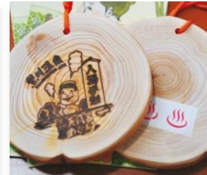
黒川温泉湯めぐり手形