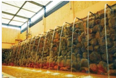
ひょうたん温泉（瀧湯）

出発日：2018年2月2日（金）、4日（日）、8日（木）、10日（土）、12日（月・祝）、16日（金）、 2月17日（土）、22日（木）、3月1日（木）、4日（日）、8日（木）、10日（土）、 3月11日（日）、16日（金）、17日（土）、23日（金）、24日（土）、25日（日）、 30日（金）、31日（土）