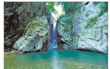
▲一之釜 (いちのかま)