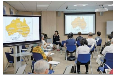
▲講座の様子(大阪・阪急グランドビル)