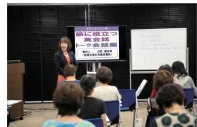
▲講座の様子(大阪・阪急グランドビル)

【阪急たびコトURL】 http://www.hankyu-travel.com/tabikoto/?9582