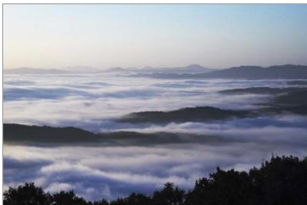
高谷山展望台 「霧の海」

阪急交通社では、“広島でしか体験できない”をコンセプトに新しい旅の魅力を追求している仮想旅行エージェンシー「広島秘境ツアーズ」とコラボレーションして企画した旅行商品新作4コースを、9月4日(日)から発売します。