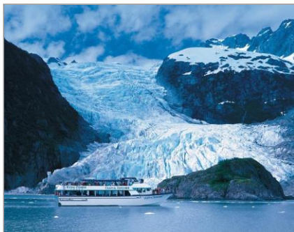
▲キーナイフィヨルド国立公園氷河クルーズ