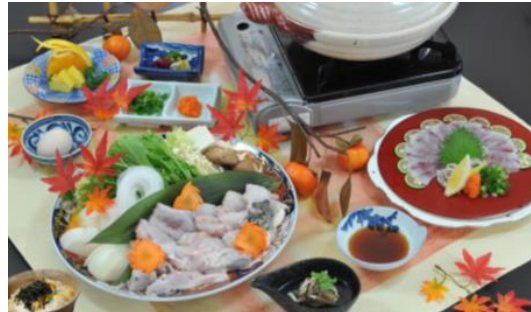
※てっちり、3名の盛り付け例