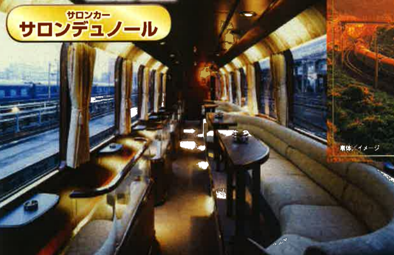
昼は雰囲気の良いサロン、夜はしゃれたバブラウンジとなるトワイライトエクスプレス車両の社交場から車窓風景をご堪能ください。