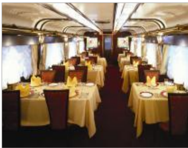
▲食堂車「ダイナープレヤデス」