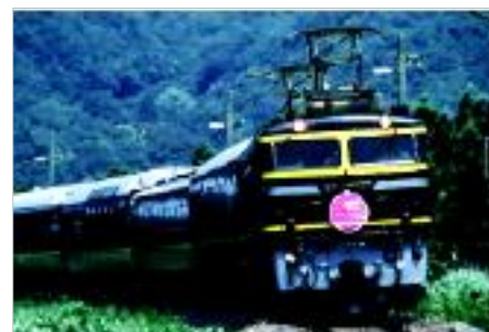
▲トワイライトエクスプレス